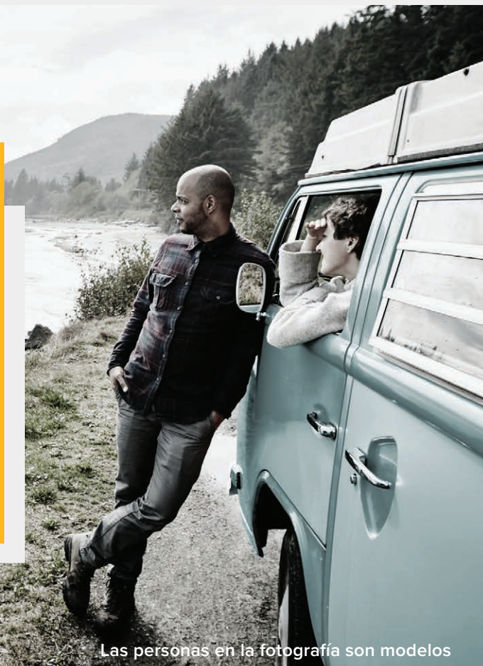
Las personas en la fotografía son modelos